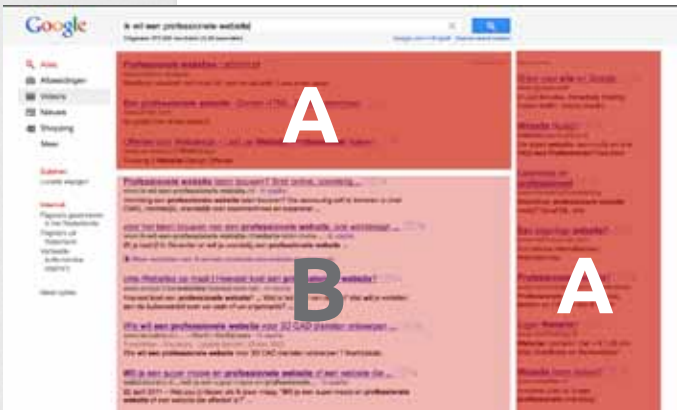
A betaalde/gesponsorde resultaten B natuurlijke/organische resultaten

In de praktijk blijkt dat de natuurlijke resultaten echter veel meer kliks opleveren dan advertenties. In tegenstelling tot natuurlijke resultaten kosten advertenties geld. Bij AdWords betaal je per klik naar je website. Het bedrag per klik is afhankelijk van de populariteit van de zoekwoorden.